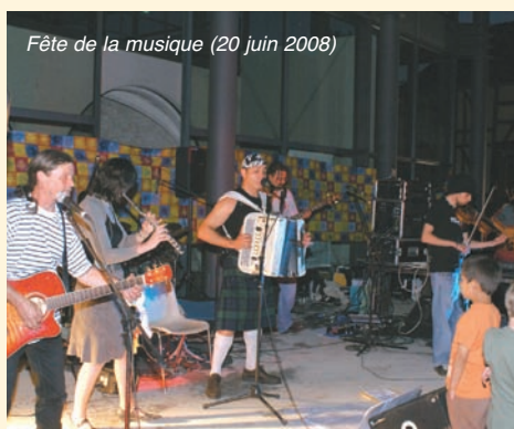
Fête de la musique (20 juin 2008)

se sont éteintes, laissant à chacun l'écho de notre première fête de la musique qui en appellera d'autres.