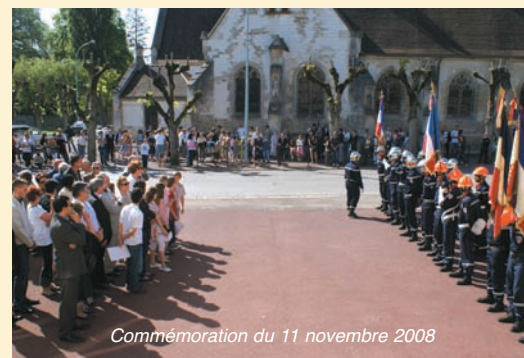
Commémoration du 11 novembre 2008