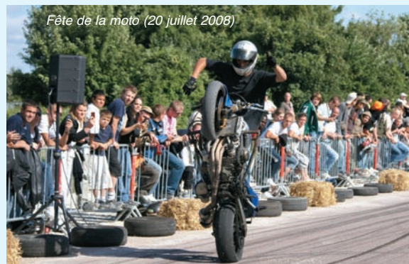
Fête de la moto (20 juillet 2008)