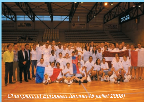
Championnat Européen féminin (5 juillet 2008)