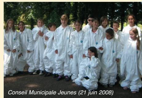
Conseil Municipale Jeunes (21 juin 2008)