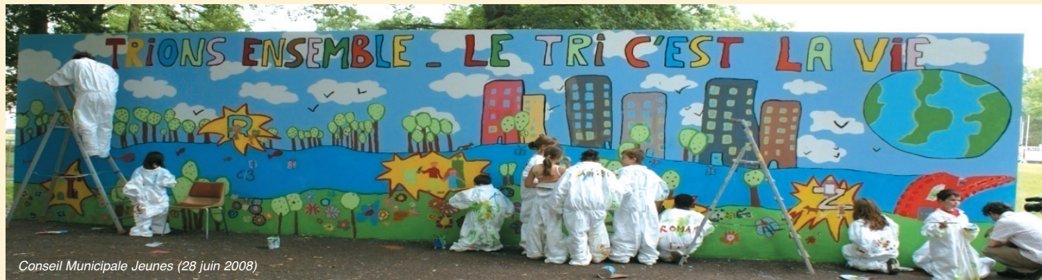
Conseil Municipale Jeunes (28 juin 2008)