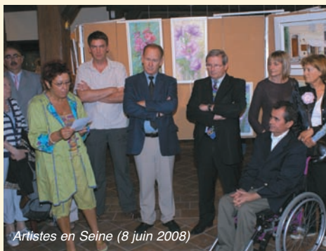
Artistes en Seine (8 juin 2008)

l'orchestre à cordes. Une chorégraphie présentée par la troupe de danse moderne « Jazz 3 », des ballets orientaux avec la troupe « Roses Orientales » ont continué d'agrémenter cette belle journée.