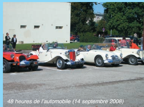
48 heures de l'automobile (14 septembre 2008)