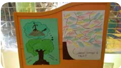
Semaine du développement durable