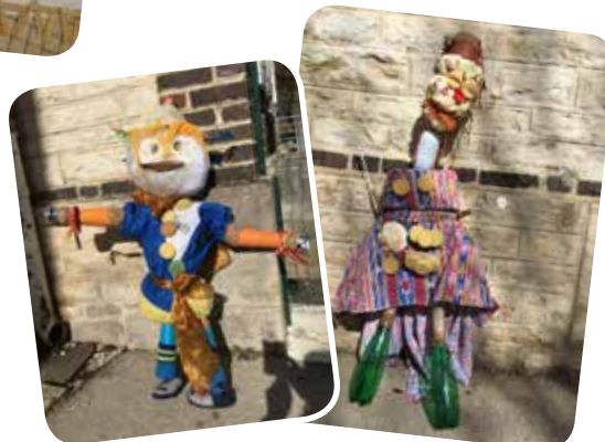
Deux épouvantails pour la bibliothèque