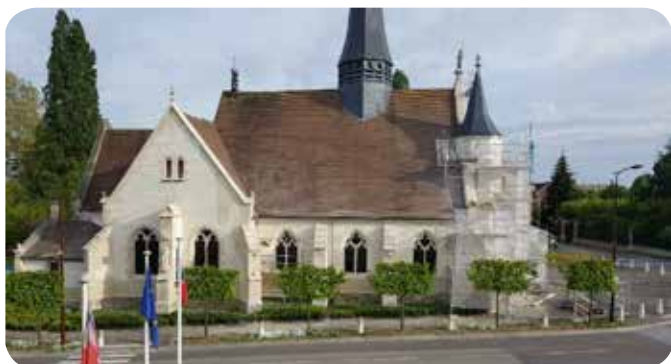
Avant / après

• Sur le site de l'école Robin Noir, le restaurant scolaire passif sera fonctionnel dès septembre pour la rentrée scolaire 2019-2020. À ce jour, le bâtiment est construit dans son ensemble, le cloisonnement, les travaux d'isolation et d'électricité ont été menés à leur terme. Il reste les travaux d'agencement, de peinture, de carrelage qui sont en cours de finition, 1 003 100 € .