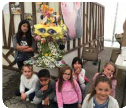
Concours de chapeau