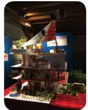
Mairie du futur