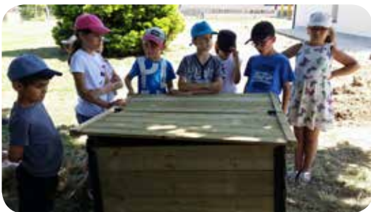
Bac à compost