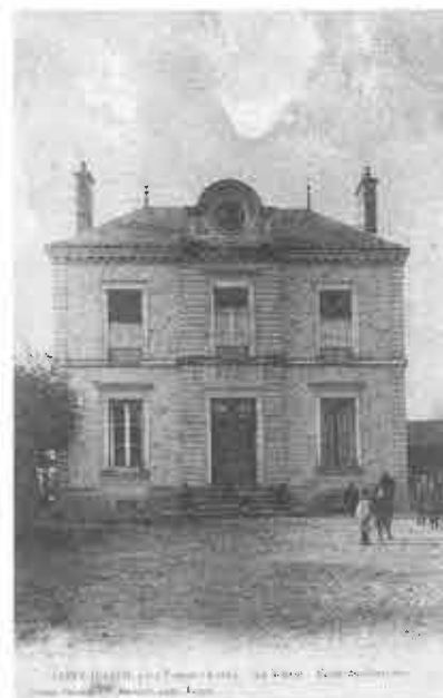
École de Filles de la rue Gambetta, construite en 1887.