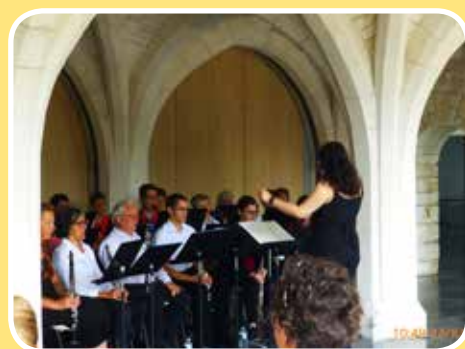
Concert de l'Harmonie l'Indépendante