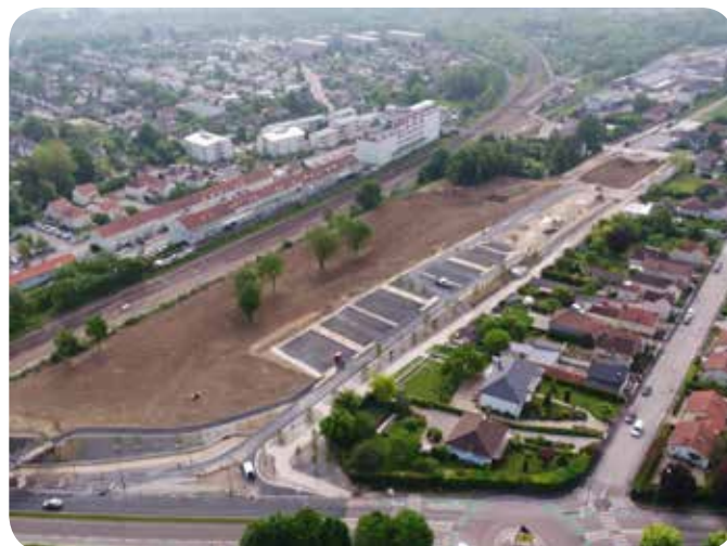
Zone Nord Ouest

Le Budget Annexe de 2 691 517 € sera financé par les ventes de terrains pour 1 854 975 €, des dotations et subventions accordées pour 700 284 € et un report de résultat positif 2018 de 136 258 €. ●