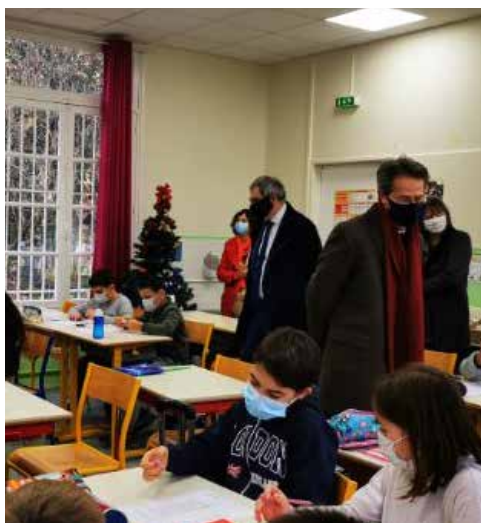
Journée de la Laïcité