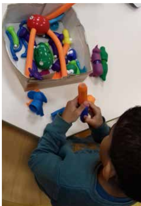
Le matériel utilisé sera isolé pendant 12h ou désinfecté entre 2 groupes

Un protocole sanitaire + un deuxième protocole sanitaire = réactivité de l'ensemble de la communauté éducative sancéenne.