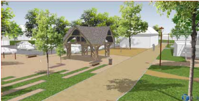
Réaménagement de l'îlot