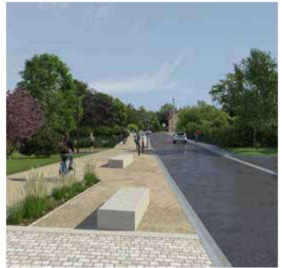
Rue de l'Hôtel de ville