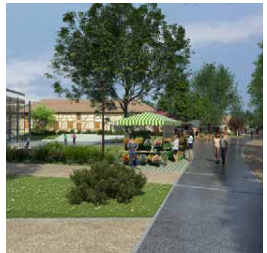
Rue Jean-Jacques Rousseau