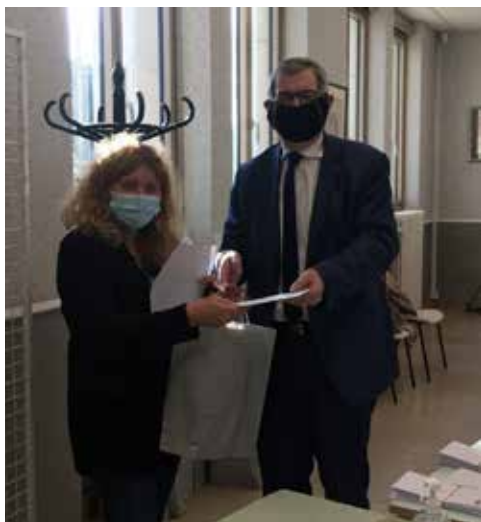
Remise de colis de Noël aux agents