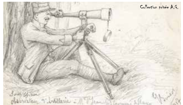
Carte dessinée par le Sergent G. Boisot en 1917