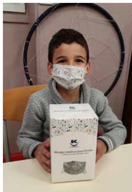
Port du masque à partir de 6 ans