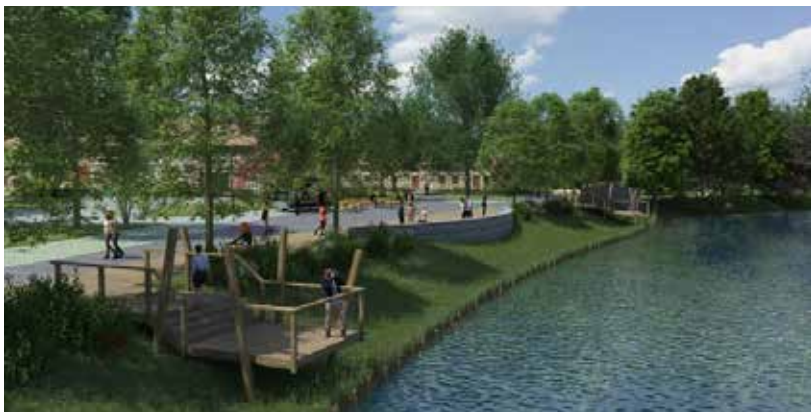
Restauration des berges

Le 6 octobre dernier s'est déroulée une réunion de présentation du projet Cœur de vie au cours de laquelle une centaine d'habitants est venue trouver place en respectant les mesures sanitaires de distanciation.