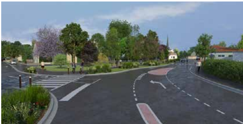
Carrefour Gambetta - Gentilly