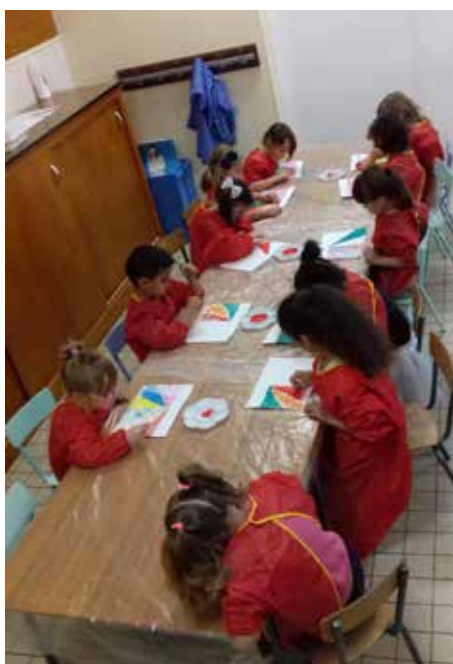
Distanciation et non brassage des groupes