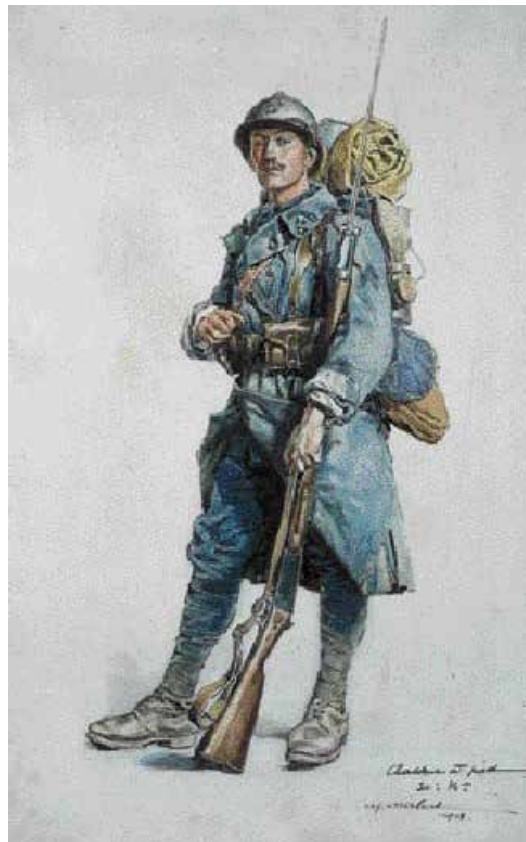
Fantassin français - chasseur à pied du 30 e bataillon

Première Guerre Mondiale. Avec 1,4 millions de morts, la France est le pays le plus touché, proportionnellement au nombre de soldats engagés. En effet, 1 soldat sur 5 va mourir durant ce conflit. Saint-Julien-les-Villas fait partie des villes qui rendent hommage à leurs soldats morts pour la France. La commune a vu 73 combattants mourir pour l'honneur du pays. Pour la mémoire collective, dressons le portrait de l'un d'entre eux.