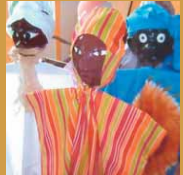
Voyage de Zoé