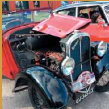
48 heures Automobiles