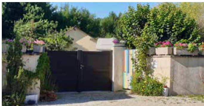
Maison Duval - 3 rue Aristide Briand