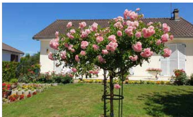
Maison Delacroix - 11 rue Bois Dorieux