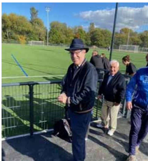
Match d'ouverture des terrains synthétiques