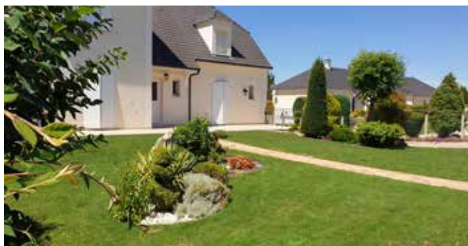
Maison Bertin - 36 rue Pasteur

Nos jardiniers et jardinières étaient à l'honneur en cette fin d'été. Fleurissement des jardins, des balcons, des espaces publics ou commerciaux, toutes les catégories étaient représentées. Vingt-huit amateurs de fleurs ont reçu leurs diplômes 2022 lors de la soirée très sympathique où chacun a pu échanger sur ses dons de mains vertes. Merci à tous pour vos efforts à embellir notre commune. ● M.B.