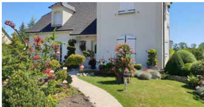
Maison Leclerc - 6 rue Jean Neveu