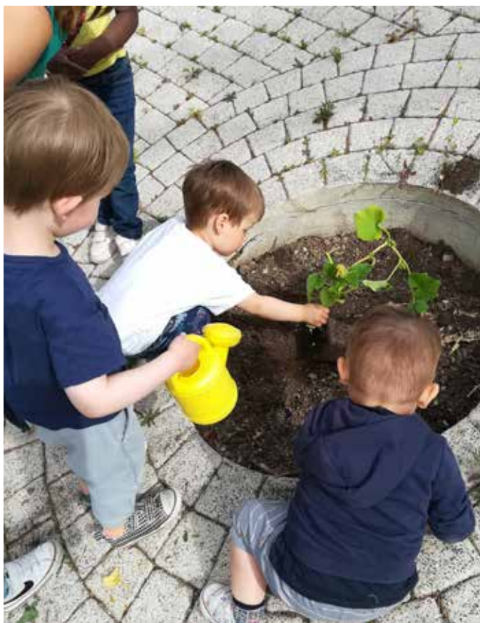
Plantation de légumes que les enfants ont dégusté par la suite

parcourent les parcs pour y retrouver d'autres enfants. Cette ouverture sur la nature, la ville se retrouve dans la pédagogie Reggio.