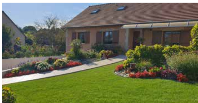
Maison Husson - 11 rue Pasteur