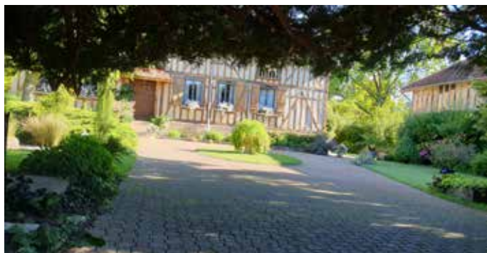
Maison Cloquemin - 6 rue Aristide Briand