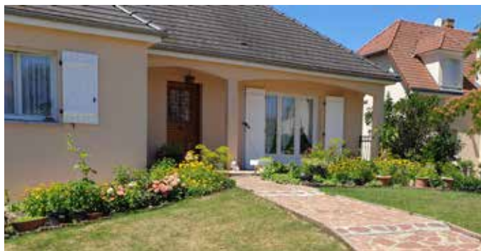
Maison Tran - 46 rue Pasteur