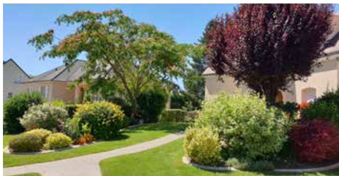
Maison Martinet - 38 rue Pasteur