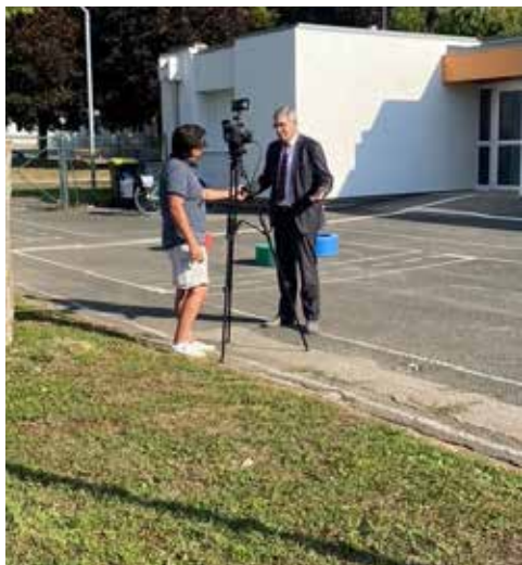
Interview Canal 32