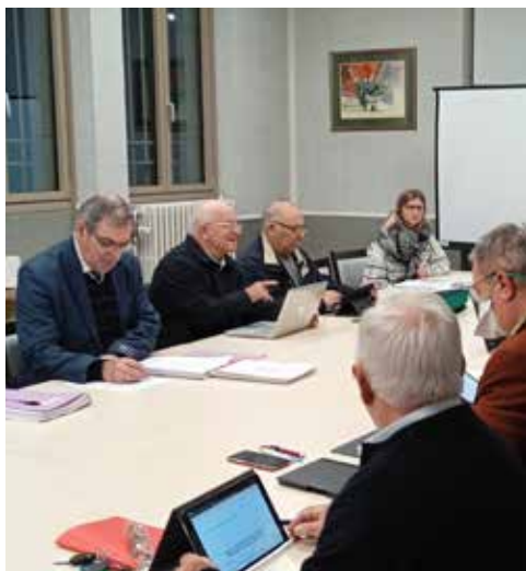
Réunion Affaires Générales