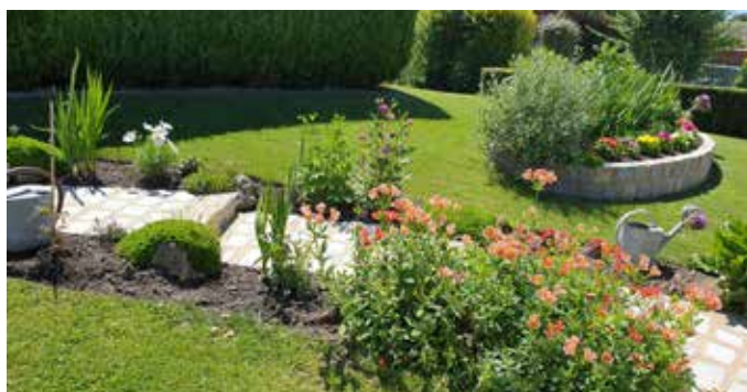
Maison Cornet - 14 rue des Louvières