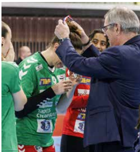
Remise de médailles aux joueuses du RSJH