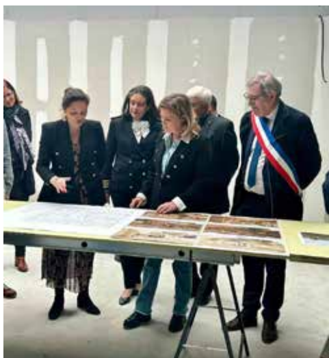
Visite avec Madame Olivia Grégoire, ministre déléguée aux PME et commerce